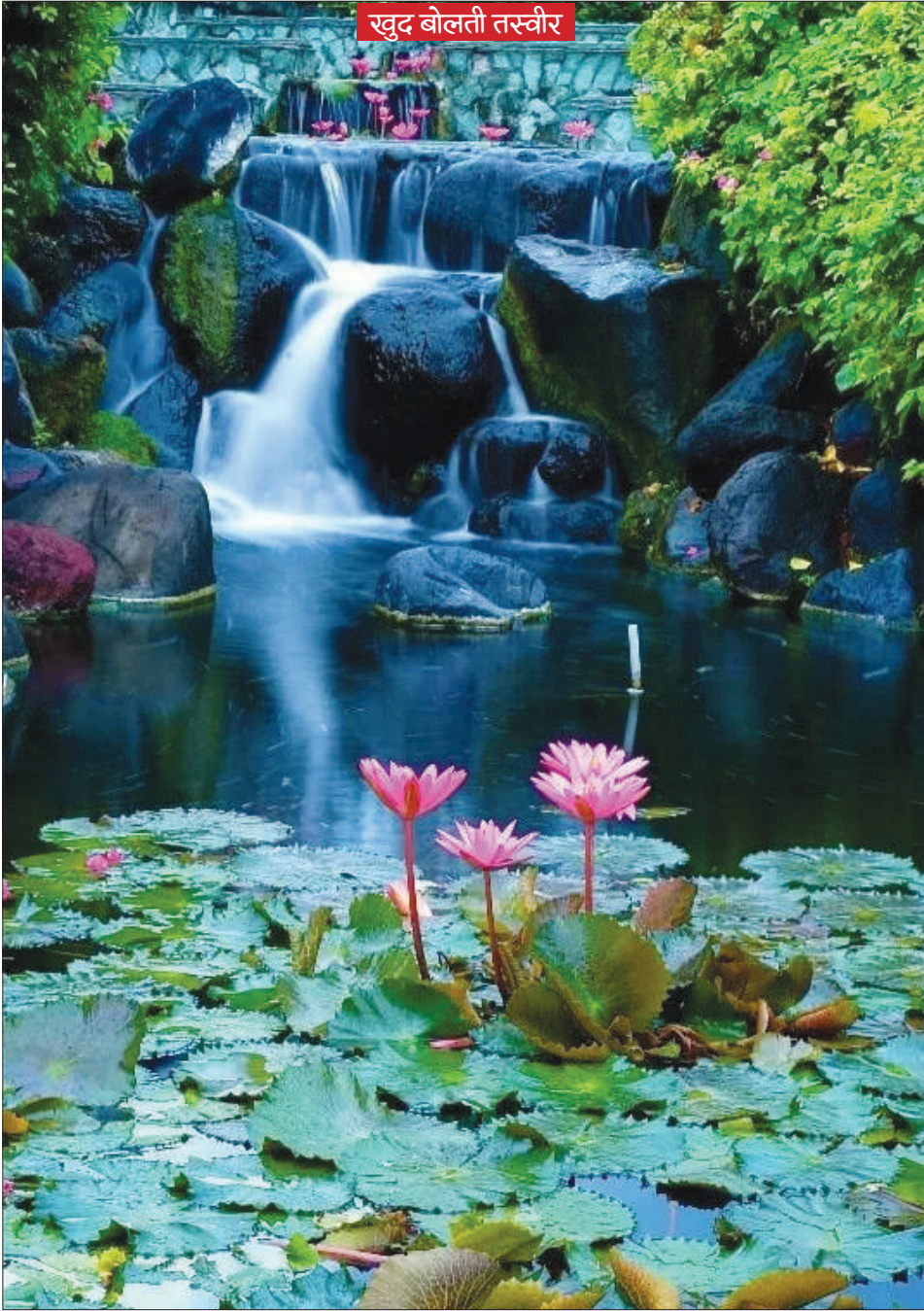
खुद बोलती तस्वीर